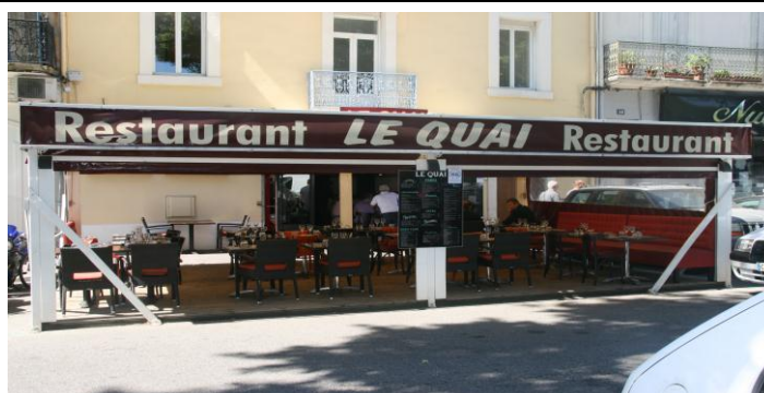
12, Quai Vallière – 11100 NARBONNE