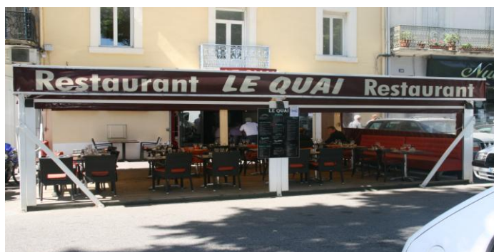
12, Quai Vallière – 11100 NARBONNE