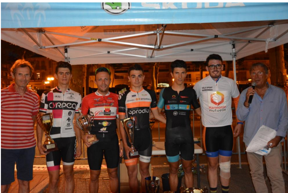
Le podium 2019